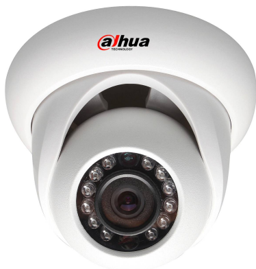
IP 1.3 Megapixel IR dome da esterno