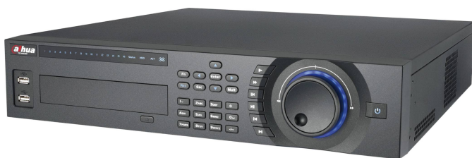
DVR 8 ingressi HD-SDI